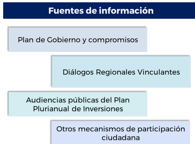
Figura 4. Fuentes de información para la definición de líneas de inversión y proyectos estratégicos

Para su construcción, se tuvo en cuenta las fuentes de información presentadas en la Figura 4.