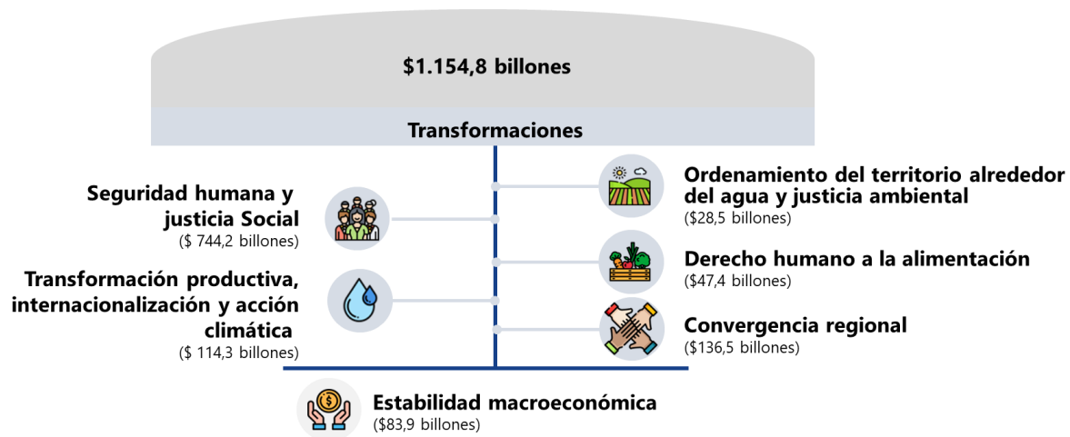
Figura 2. Distribución por transformaciones del PND