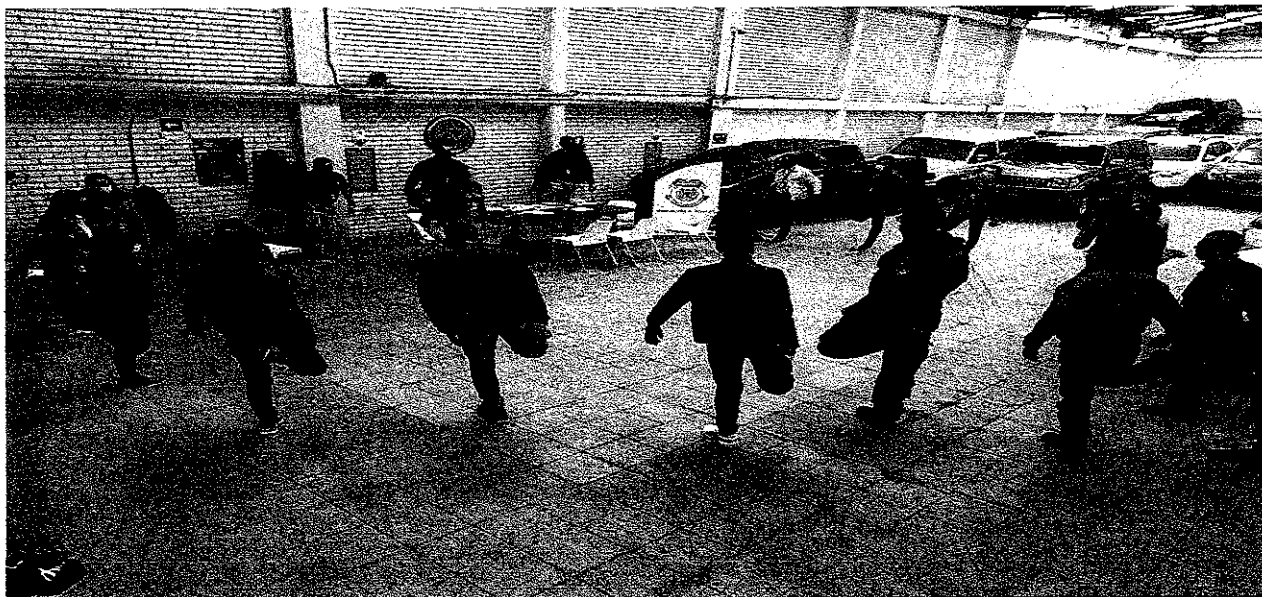
Evidencia foto No 4 Capacitación