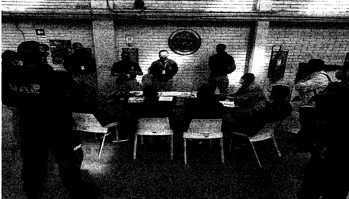
Evidencia foto No 1 Capacitación