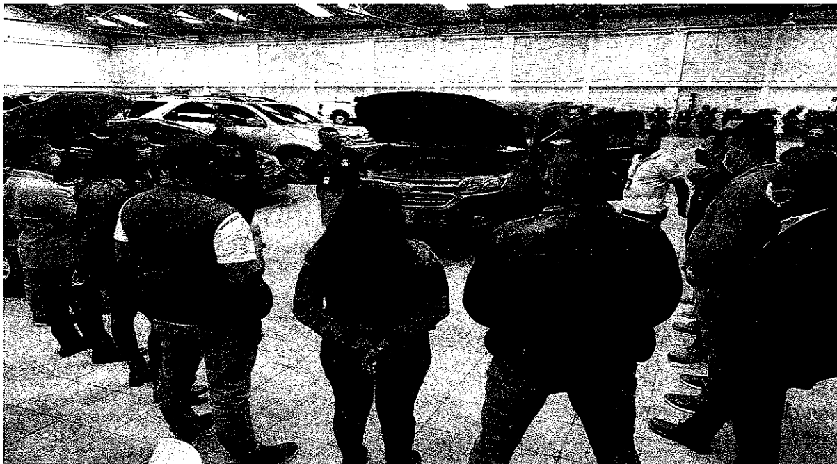
Evidencia foto No 2 Capacitación