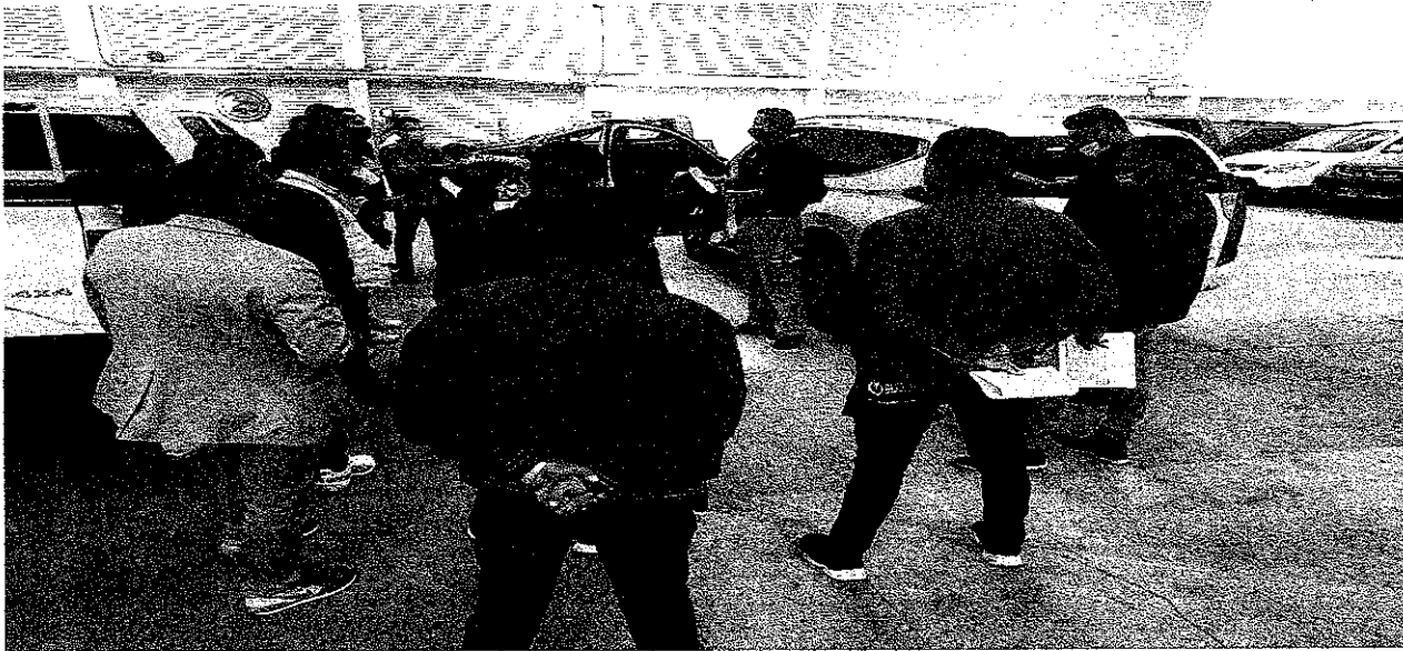
Evidencia foto No 3 Capacitación