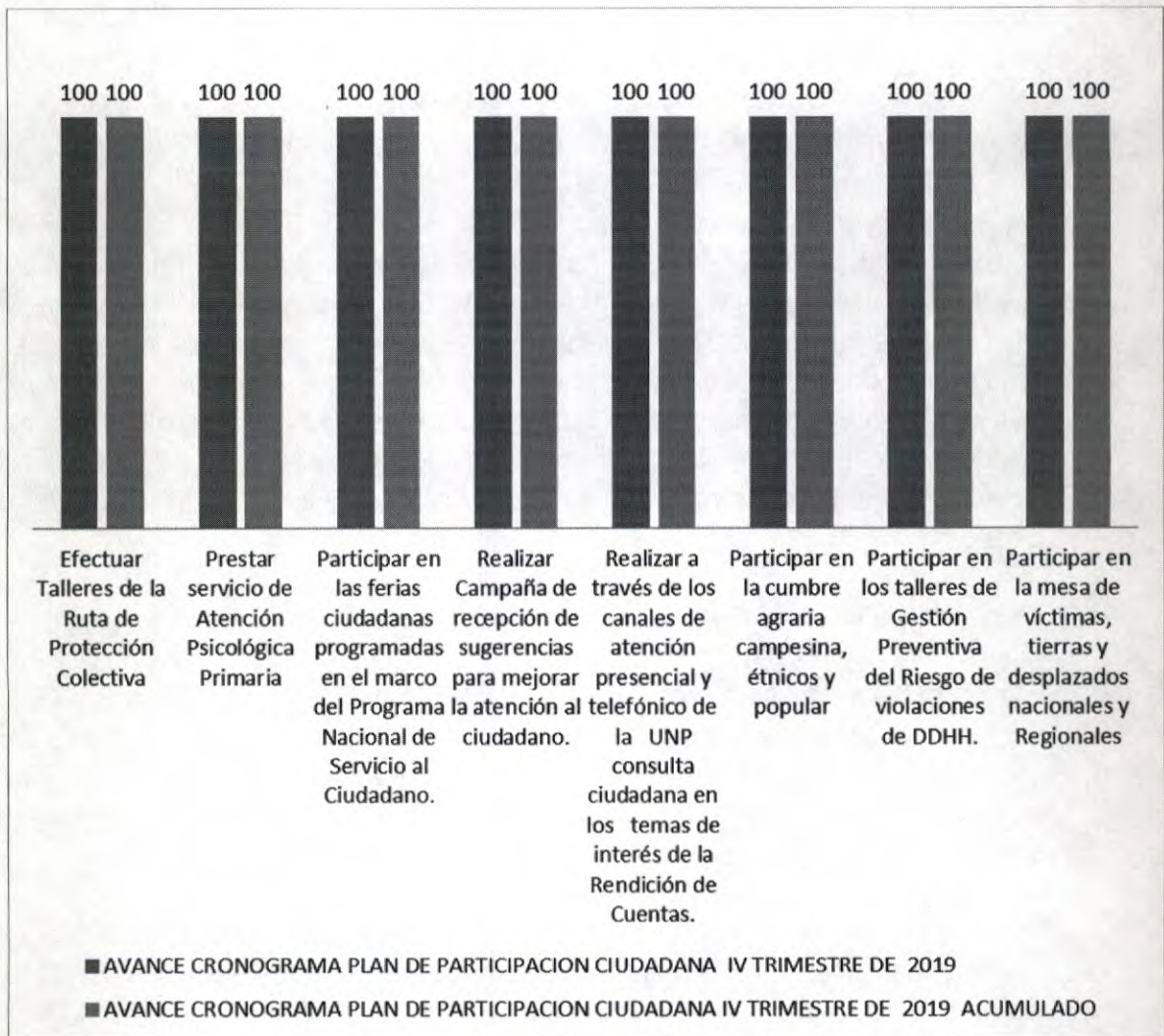
Ilustración 1. Avance cumplimiento actividades a 31 de diciembre de 2019:

Así mismo, la Unidad Nacional de Protección durante el cuarto trimestre de 2019 efectuó seguimiento al cronograma del Plan de Participación Ciudadana correspondiente a 8 objetivos, el cual reporto un avance del 100% en el trimestre y un avance acumulado del 100% en la vigencia 2019.