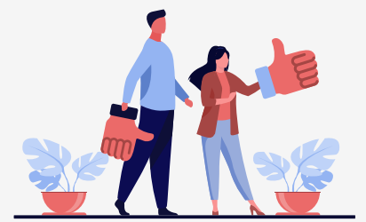
Población Objeto y Grupos de Interés Satisfechos