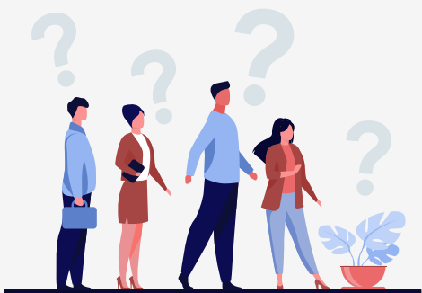
Necesidades y Expectativas de la Población Objeto y Grupos de Interés